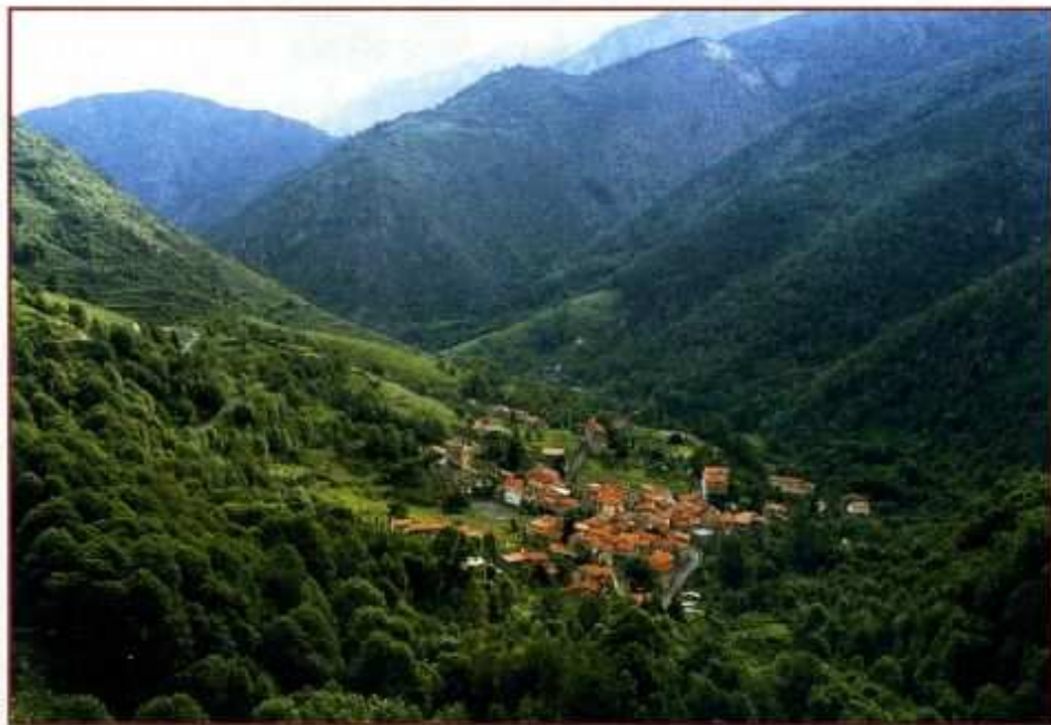
Village de Py

Afin de faciliter la prise en compte des enjeux patrimoniaux dans la définition des interventions de gestion ou d'exploitation sur les 60 000 ha de forêt du territoire, le projet de Parc travaille à l'élaboration d'un manuel simple de gestion à l'usage des propriétaires et exploitants forestiers. Ce guide permettra d'identifier sur le terrain les milieux remarquables liés à la forêt et proposera des interventions sylvicoles adéquates pour une meilleure prise en compte de ce patrimoine.